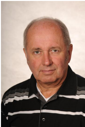
Rolf Fix Sport