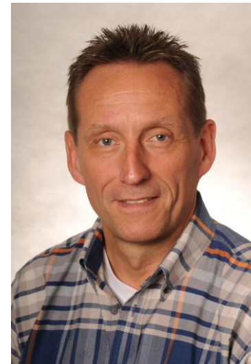
Ulli Pütz Veranstaltungen